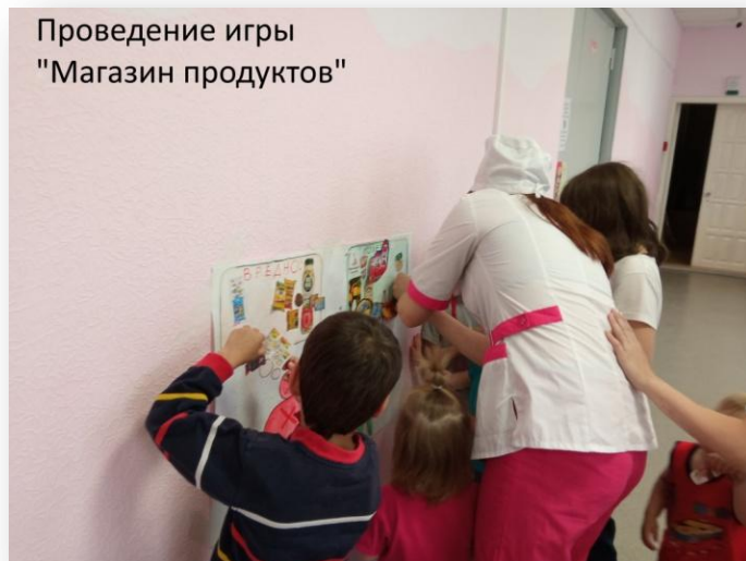
Проведение игры "Магазин продуктов"

Дети с интересом слушали информацию о важности ведения здорового образа жизни, разгадывали загадки, задавали много вопросов, проявили себя очень любознательными. Большой интерес вызвала игра «Магазин продуктов», которая помогла детям закрепить новые знания о здоровом питании.