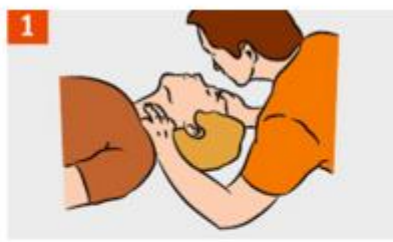
Признаки жизни: пульс