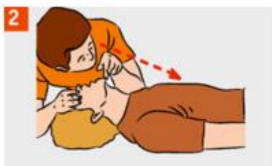
Признаки жизни: дыхание