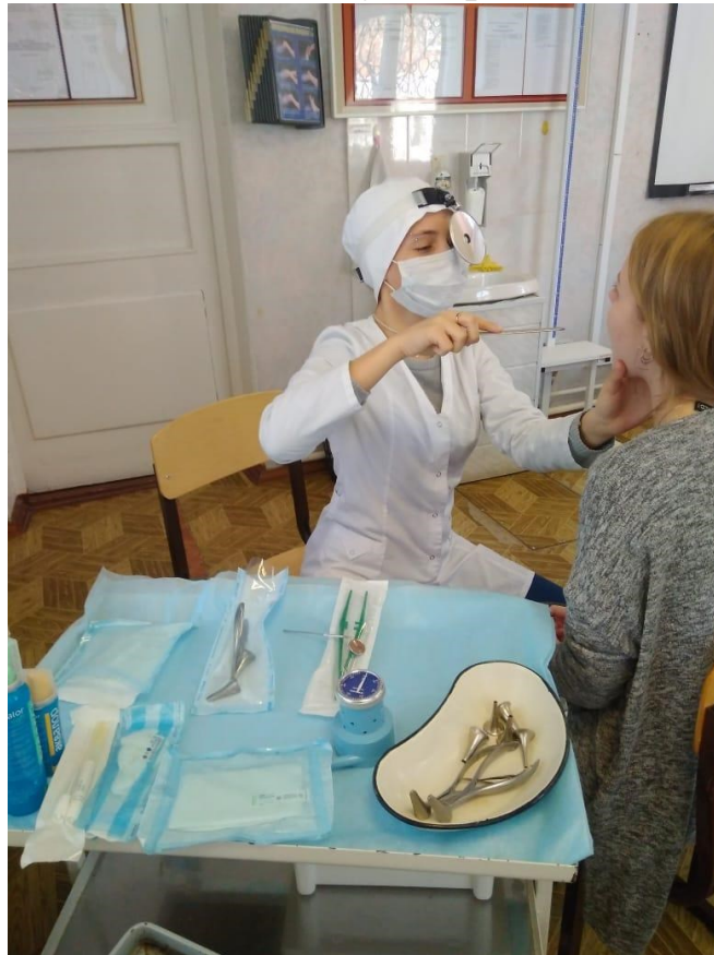
Кабинет сестринского дела