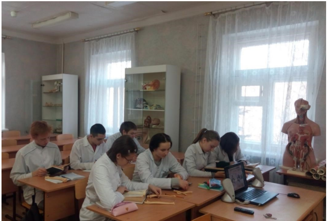
Кабинет Анатомии и физиологии человека