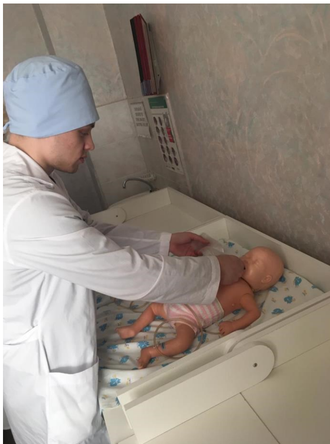
Кабинет сестринского дела