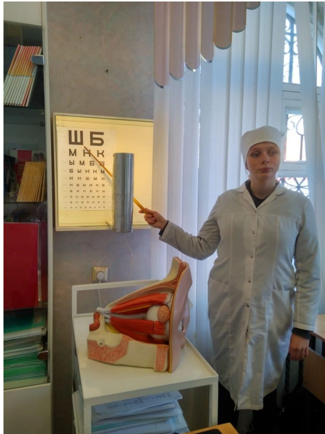
Кабинет сестринского дела