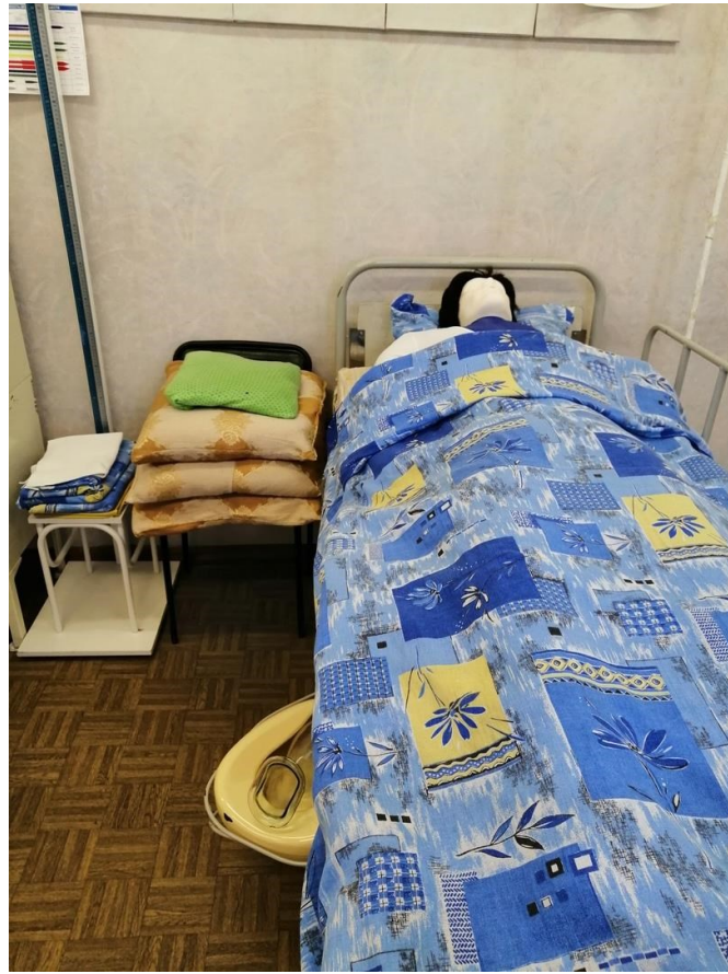
Кабинет сестринского дела